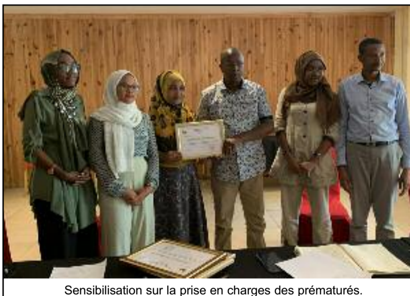
Sensibilisation sur la prise en charges des prématurés.